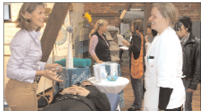
Der Body Mass Index wurde von der DAK gemessen und analysiert. Die Besucher erhielten anschließend Tipps für gesunde Ernährung.