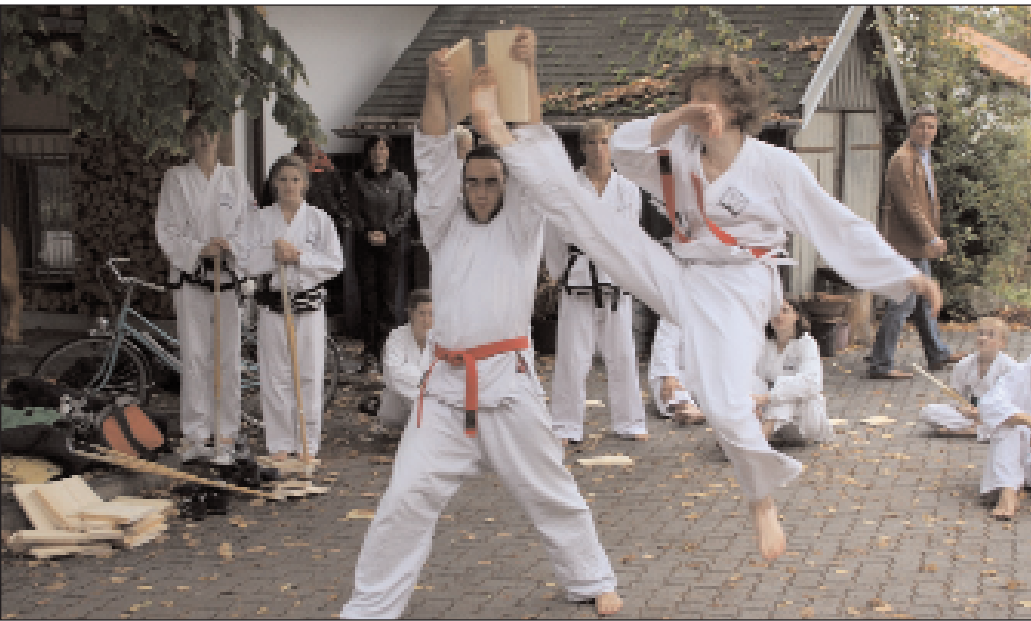
Mit einer atemberaubenden Show, gespickt mit spektakulären Sprungkicks, zeigte die TwinTaekwondo-Truppe, wie fit sie ist.