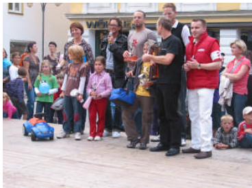
Siegerehrung BOBBY CAR – Rennen