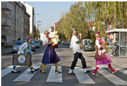
Die singenden KlinikClowns