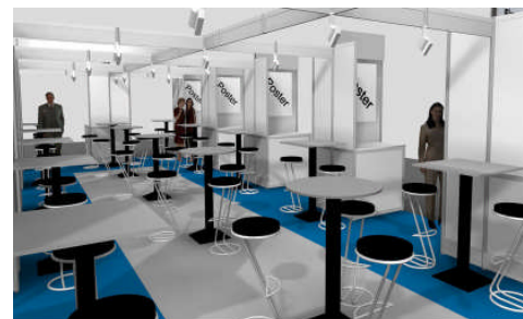
Gemeinsame Besprechungs- fläche